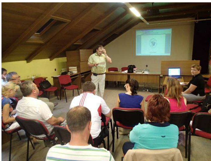
Obr. 10: Komunitní seminář školy venkova ve Strážnici k osvojení nových metod pro tvorbu strategie CLLD v území regionu Strážnicka

V roce 2014 byla MAS Strážnicko dokončila realizaci Strategického plánu v rámci programu Rozvoje venkova a získala podporu pro 65 projektů Realizace SPL a 31 aktivit v rámci 6 projektů Spolupráce, a tak úspěšně naplnila svůj Strategický plán Leader pro roky 2007 – 2013 realizací aktivit MAS i monitoringem projektů. V hodnocení 130 MAS dělených do 4 kategorií jsme byli zařazeni do nejlepší kategorie „Příkladně fungující MAS“ . V roce 2014 MAS začala s přípravou standartizace MAS a schválila analytickou část pro nový strategický dokument CLLD pro období 2014-2020.