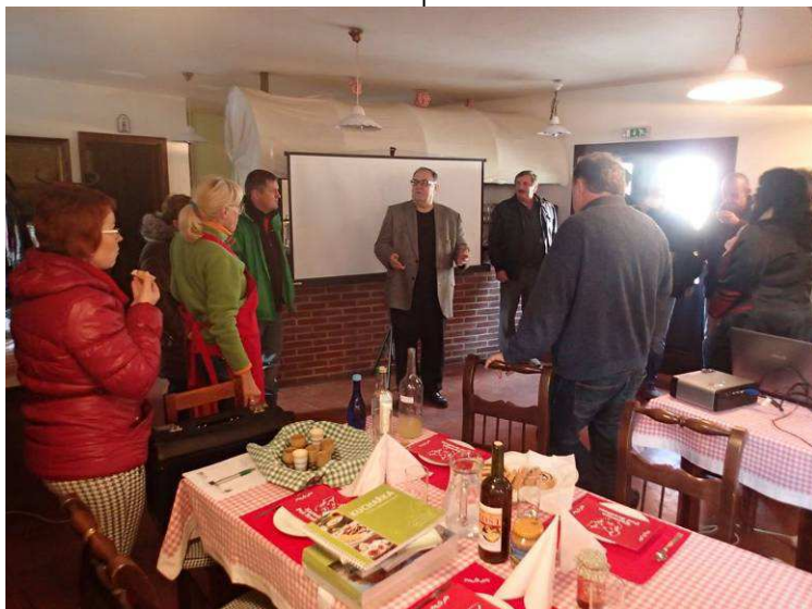
Obr.8: Tématický seminář k tradici zabijaček na moravsko-slovenském pomezí v Košariskách u Myjavy a panel Kopaničarské ovocno-destilátové cesty.

Kancelář MAS Strážnicko také připravuje každoročně ve spolupráci s Mikroregionem Strážnicko DSO, propagaci návštěvnických míst, vydání Průvodce Strážnicka , který vyšel v roce 2014 v dotisku 5 000 výtisků.