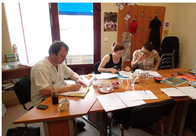
Obr.: Setkání pracovní skupiny pro mladé a tvorbu strategie v MAS Strážnicko

Funkce programového výboru vykonává rada, funkce monitorovacího výboru kontrolní výbor.