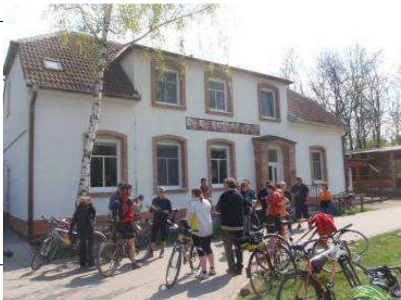
Obr. 5: Cykloexkurse členů MAS po projektech MAS před v nově upraveným domem zahrádkářů v Sudoměřicích