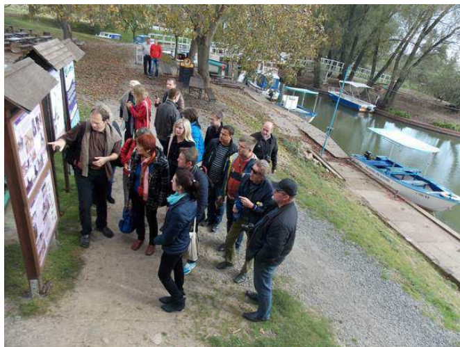
Foto: Seminář a exkurse zástupců MAS po návštěvnických místech Strážnicka v květnu 2014

V roce 2014 se naše MAS, jako člen Národní sítě MAS, účastnila setkání tohoto sdružení na celostátní konferenci Venkov, mezinárodní akce Leaderfest. Strážnicko MAS jako člen NS MAS ČR a KS NS MAS JMK. s KS MAS realizovala dva vzdělávací semináře pro podporu šetrného hospodaření v krajině. Spolupracuje s řadou dalších subjektů a účastní se řady setkání a akcí k rozvoji venkova ve spolupráci se Spolkem obnovy venkova, Jihomoravským krajem, Centrálou cestovního ruchu, CSV, MZE, MŽP apod. Naše MAS také připravila řadu exkurzí a návštěv po realizovaných projektech dobré praxe pro další MAS z ČR a ze zahraničí.