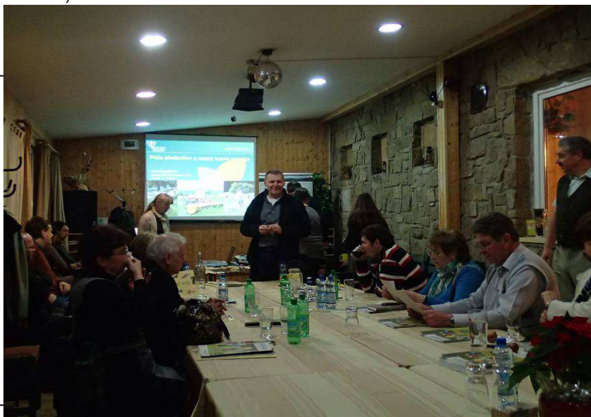
Obr.2: Představení možností spolupráce obcí, MAS a CHKO na setkání s CHKO Bílé Karpaty v Lopeníku.