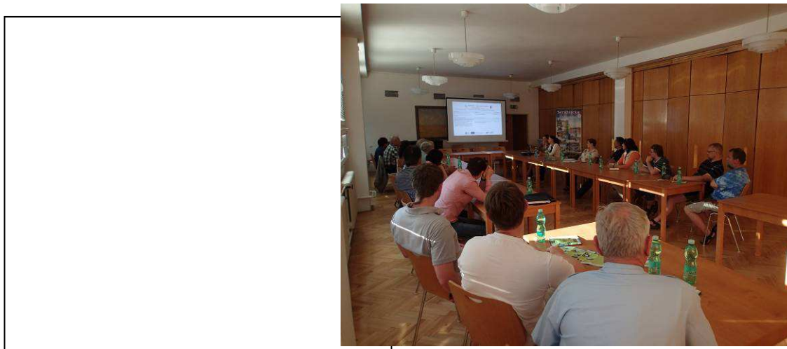
Obr. 1: Projednávání analytické části CLLD se zástupci města a spolků ve Strážnici, 18.6.2014.

Cílem MAS je podpořit a rozvinout maximum schopných inovativních projektů pro obnovu a rozvoj venkova na Strážnicku. V rámci projektů podporujeme obce, podnikatele, občanská sdrúžení i aktivní jednotlivce z obcí Strážnicka, kteří mohou realizovat své projekty pro rozvoj území Strážnicka s dotací do 60 % nákladů (investice podnikatelů) až 90 % nákladů (projekty nezakládající veřejnou podporu sdrúžení, spolků a obcí). Každý podaný projekt je hodnocen a bodován Výběrovou komisí MAS podle předem schválených bodovacích kritérií . Ve výsledném pořadí jsou projekty navrženy ke schválení Radou MAS a schváleny k realizaci Státním zemědělským intervenčním fondem (SZIF) MZe ČR. Vybraní žadatelé po schválení podepisují Dohodu se SZIF o dotaci na projekt (50-90%), kterou však získají do 12 týdnů po vlastním profinancování celé akce (tj. 100% nákladů projektu) . Proto je také důležité zajistit schopnost vlastního předfinancování každého projektu (úspory, půjčka, úvěr...) a zajistit proplacení realizace řádně vybrané dodavatelské firmě přes vlastní účet.