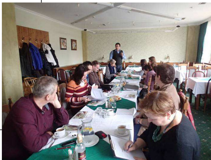
Obr.8: Pracovní jednání z projektu spolupráce 10 MAS JMK ve Strážnici.