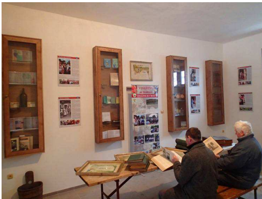
Obr.7: Nová expozice ve zpřístupněném Domě zahrádkářů ve Strážnici.

Zpracovatel: Mgr. Vít Hrdoušek, členové MAS a externí poradci